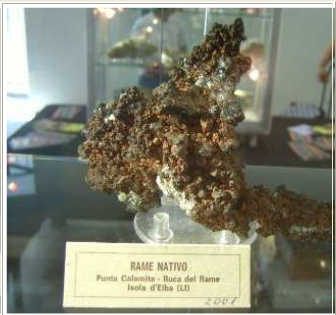
RAME NATIVO Punta Calamita - Buca del Rame Isola d'Elba (LI) 2007