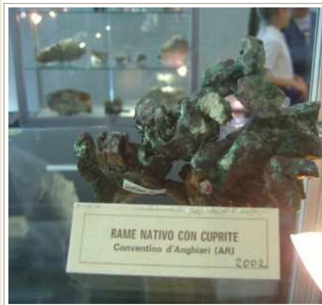
RAME NATIVO CON CUPRITE Conventino d'Anghiari (AR) 2002