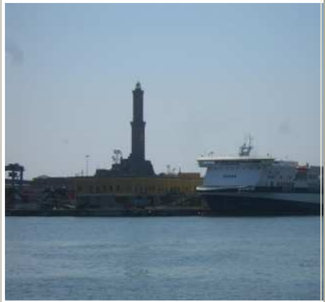
panoramiche del Porto Antico

Il successo è stato confermato anche dalla notevole curiosità della cittadinanza, diversi persone si sono fermate per chiedere informazioni sulla manifestazione e per complimentarsi con gli espositori e con l'organizzazione e per l'interesse e la qualità dell'evento.