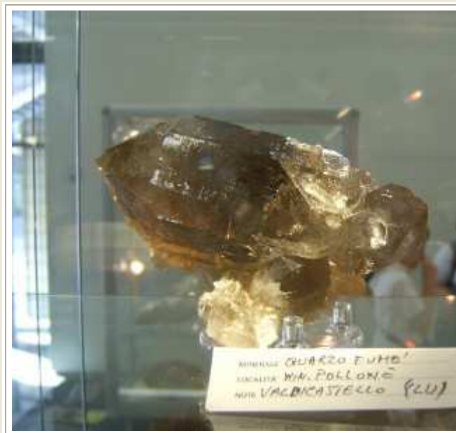
MINERALI QUARZO FUMO' SINGOLA MIN. POLLONIC MUSEO VADICASTELLO (LU)