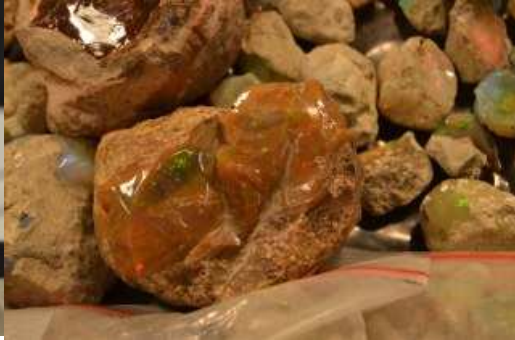
Ortoclasio di Baveno e Opale dall'Etiopia