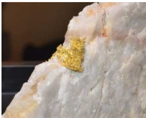
Un bel campione di Eritrite e due bei campioni di oro nativo di Brusson