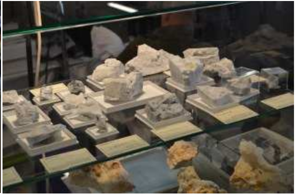
Alcuni espositori di pietre dure , gioielli e gemme