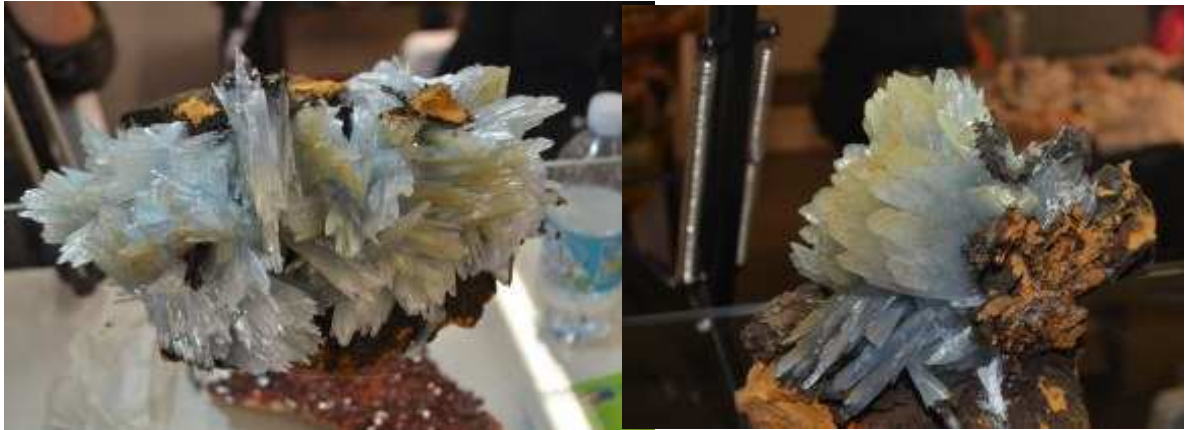
Le nuove Bariti azzurre di Nador Marocco e sotto Flourite dalla Mongolia e Adamite Messicana