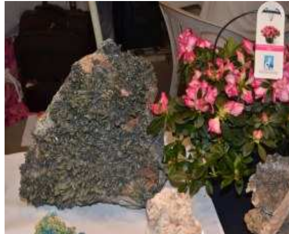
In alto Prasio e Ilvaite di Serifos , Sampleite Cilena e un grande Prasio Elbano