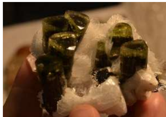
Smeraldo Colombiano e Elbaiti Pakistane