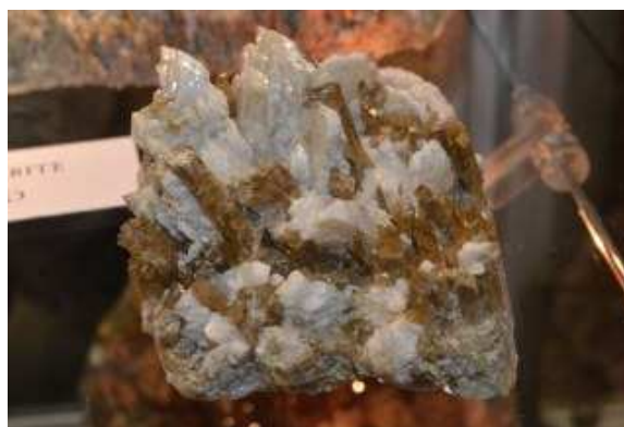
Alcuni campioni di hessonite di varie provenienze liguri e una clinozoisite con albite